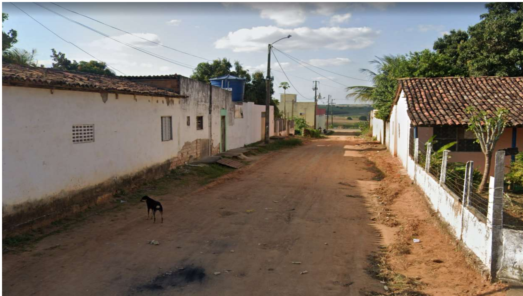
Figura 3: RUA E – CAPIM