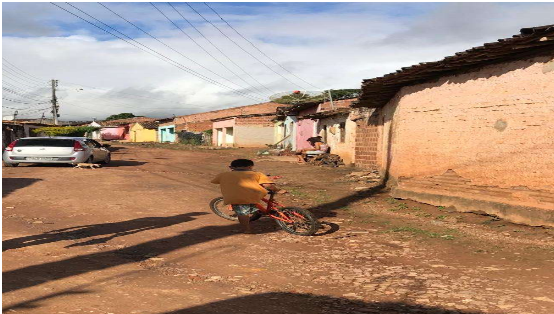
Figura 15: RUA 07 - VILA FERNANDES