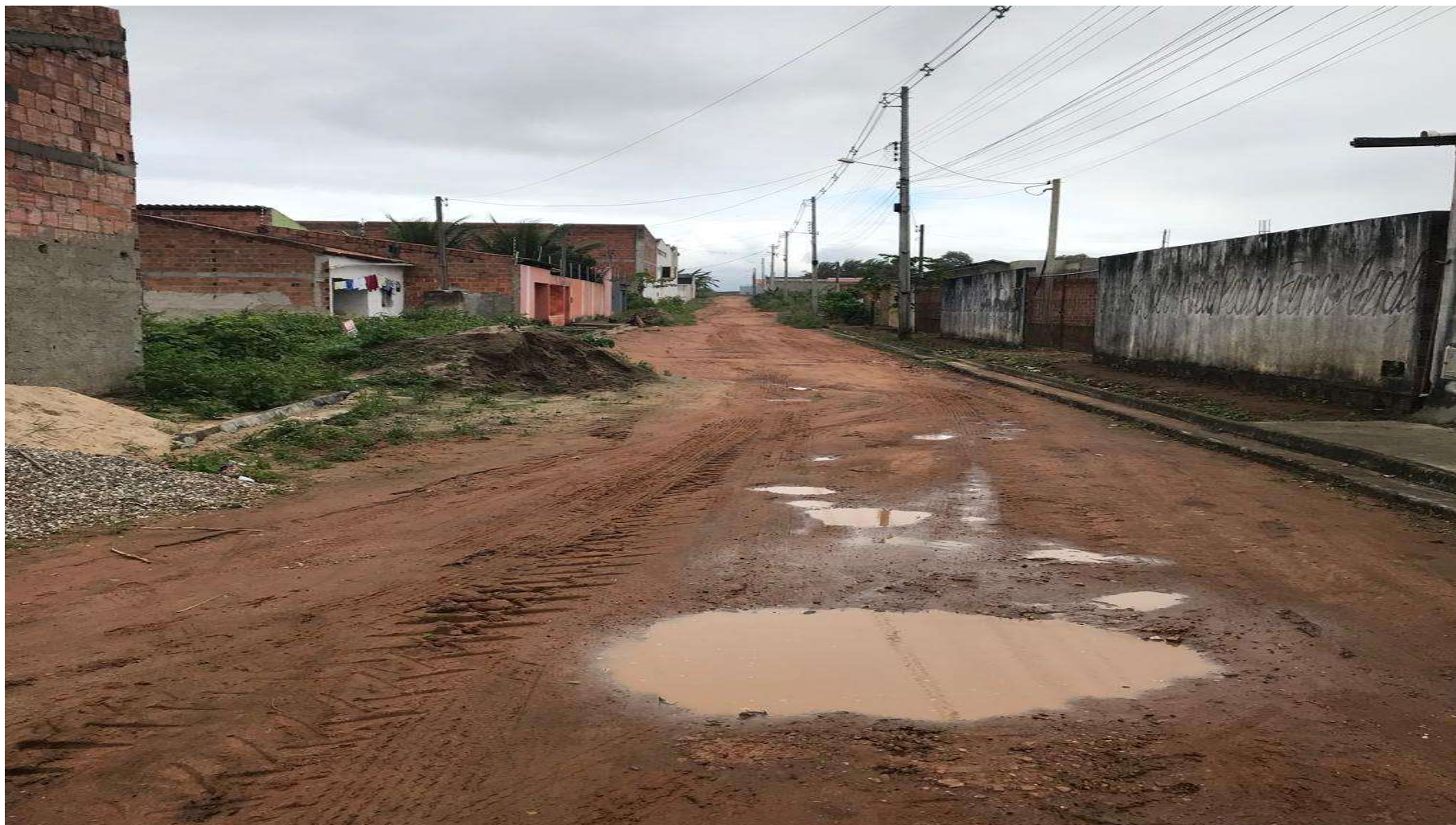
Figura 11: RUA 09 - VILA FERNANDES