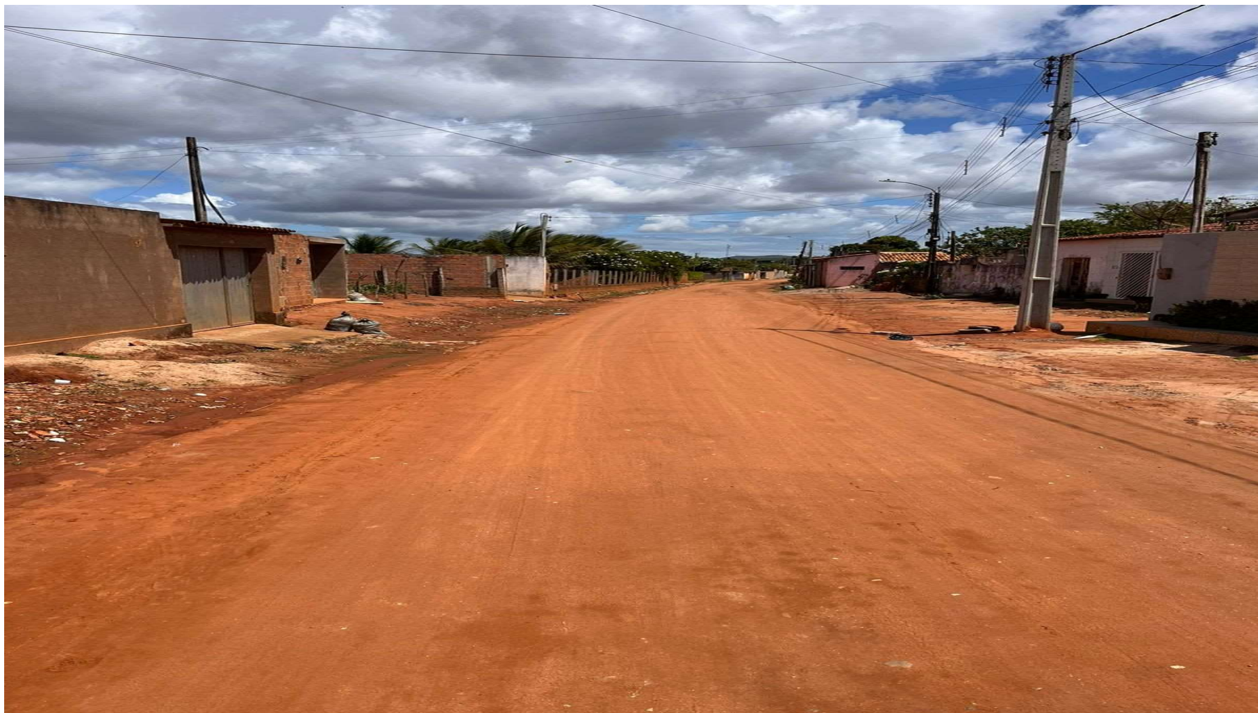
Figura 1: RUA C – CAPIM