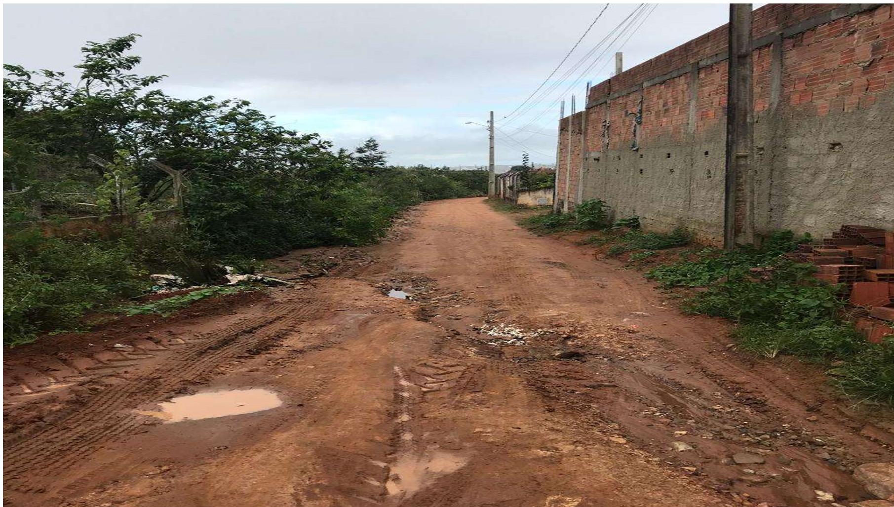
Figura 12: RUA 02 - VILA FERNANDES