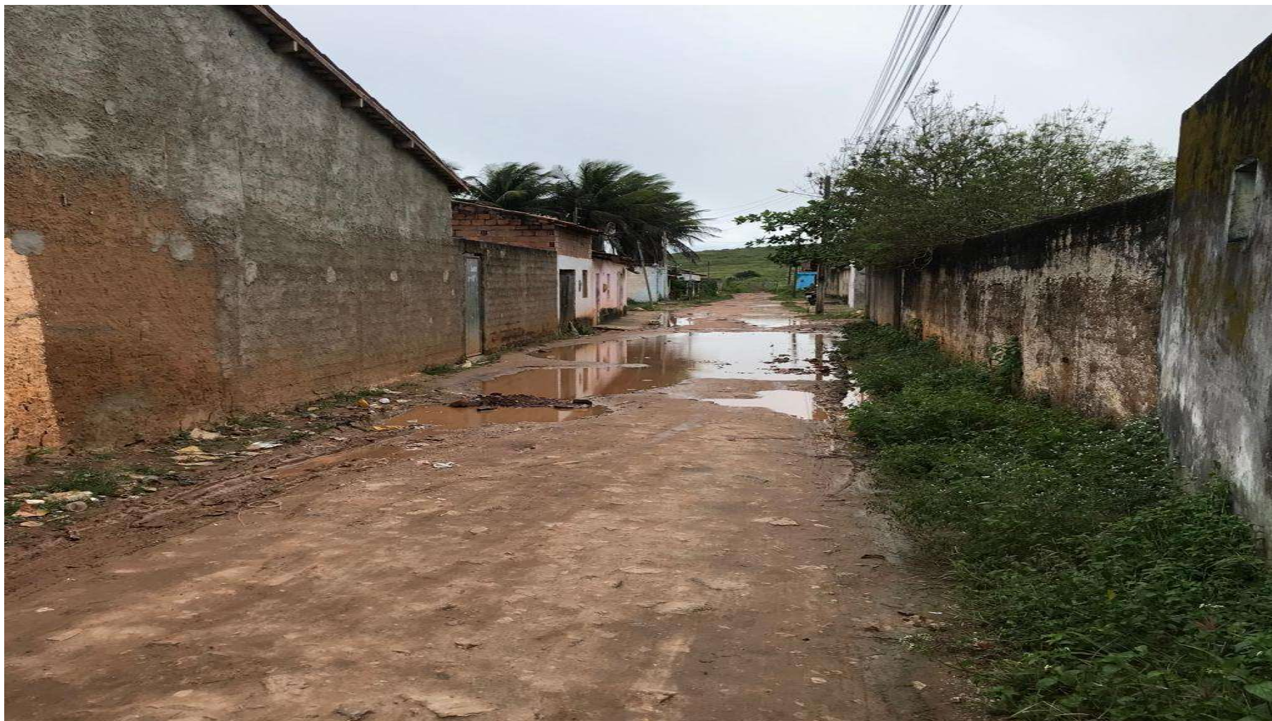
Figura 14: RUA 06 - VILA FERNANDES