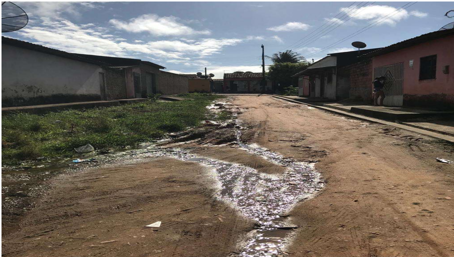
Figura 9: RUA B - VILA SÃO FRANCISCO