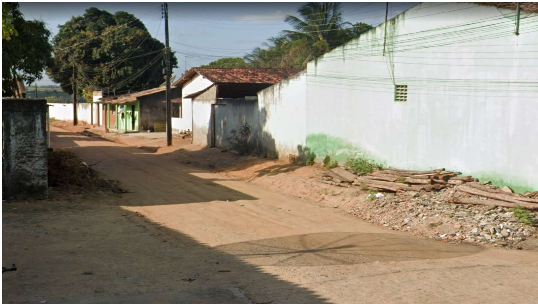
Figura 4: RUA F – CAPIM