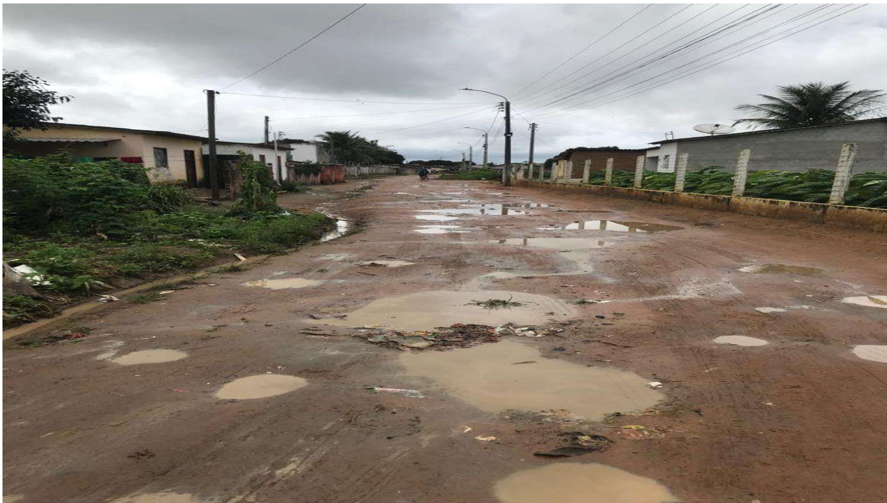
Figura 7: RUA J – CAPIM