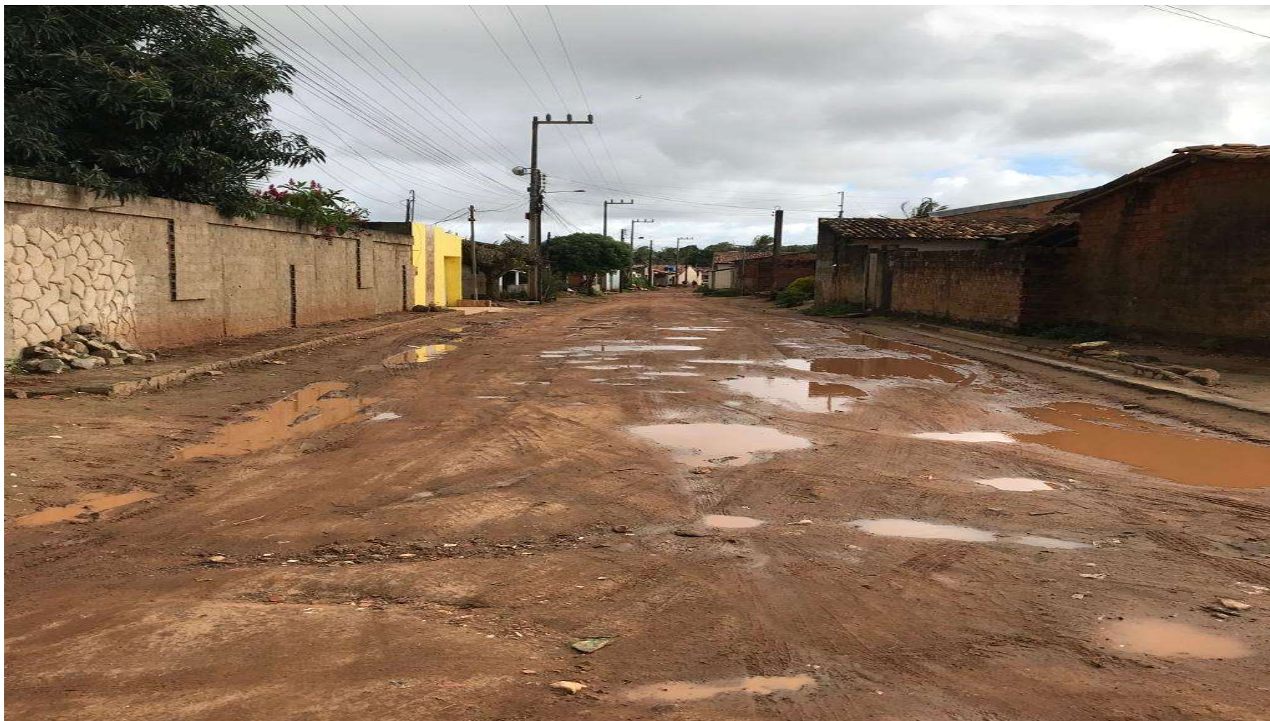
Figura 13: RUA 05 - VILA FERNANDES