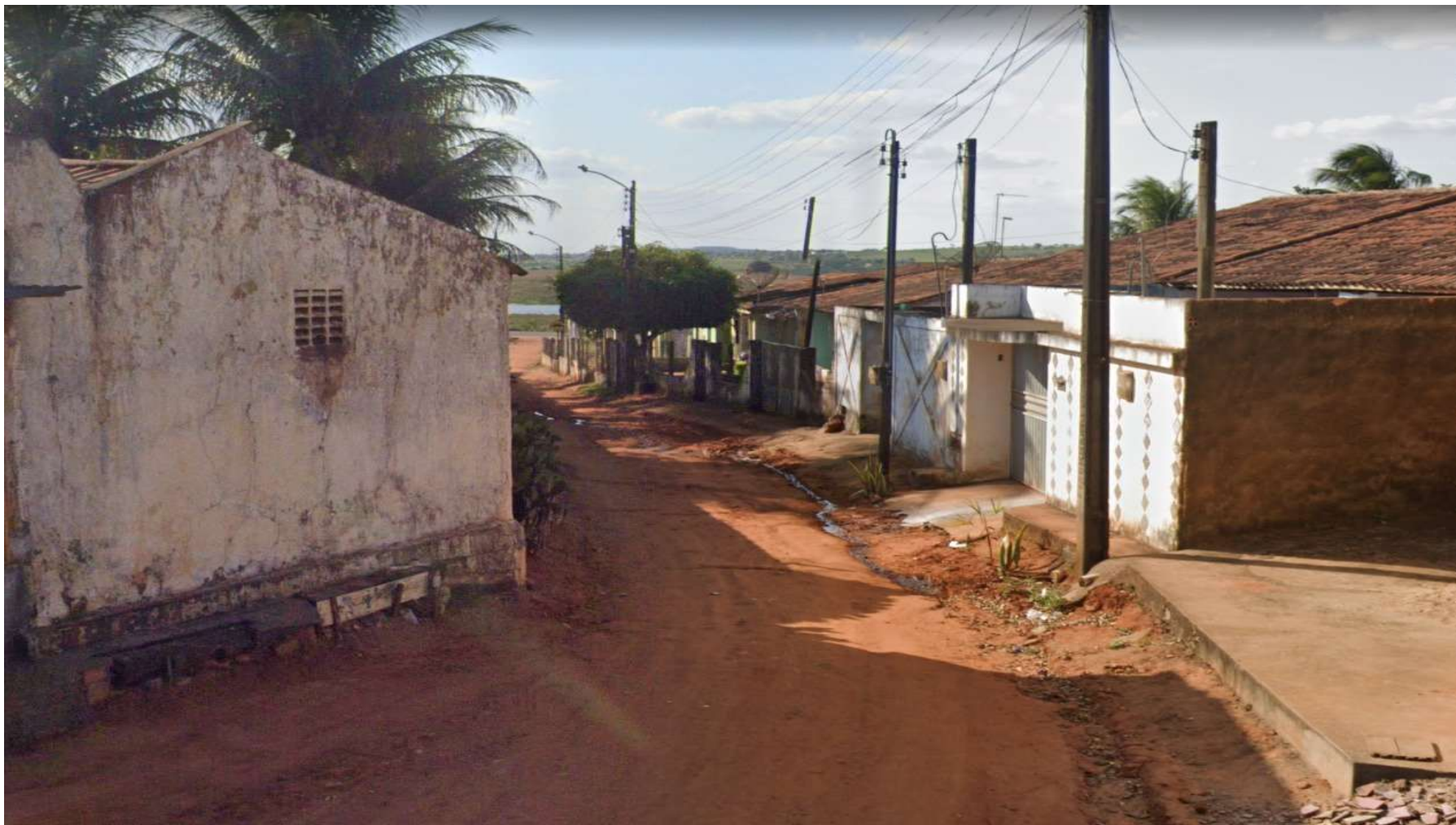
Figura 2: RUA D – CAPIM