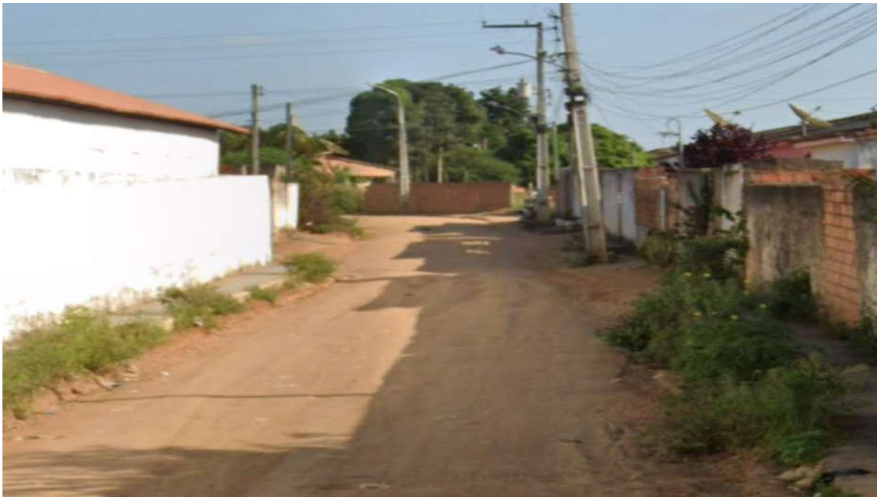
Figura 5: RUA H – CAPIM