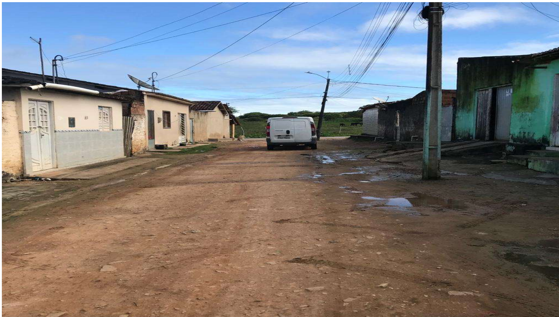
Figura 8: RUA C - VILA SÃO FRANCISCO