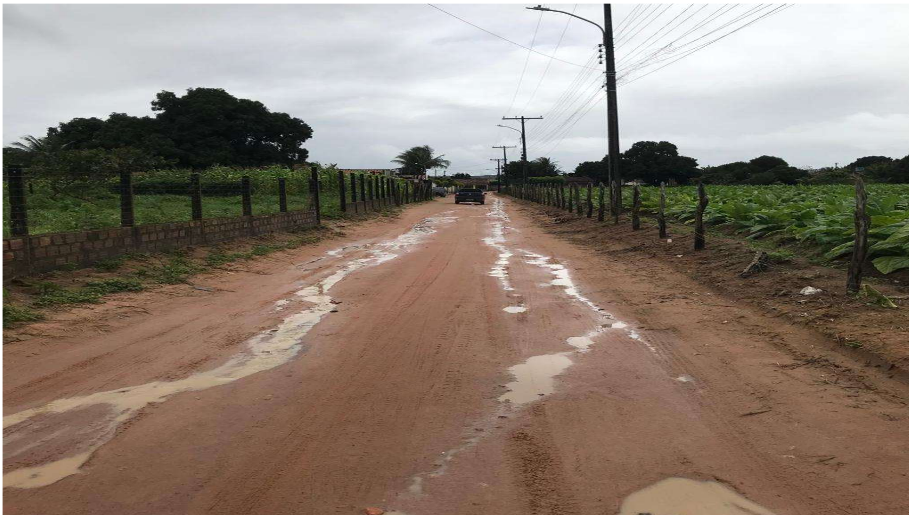
Figura 6: RUA I – CAPIM