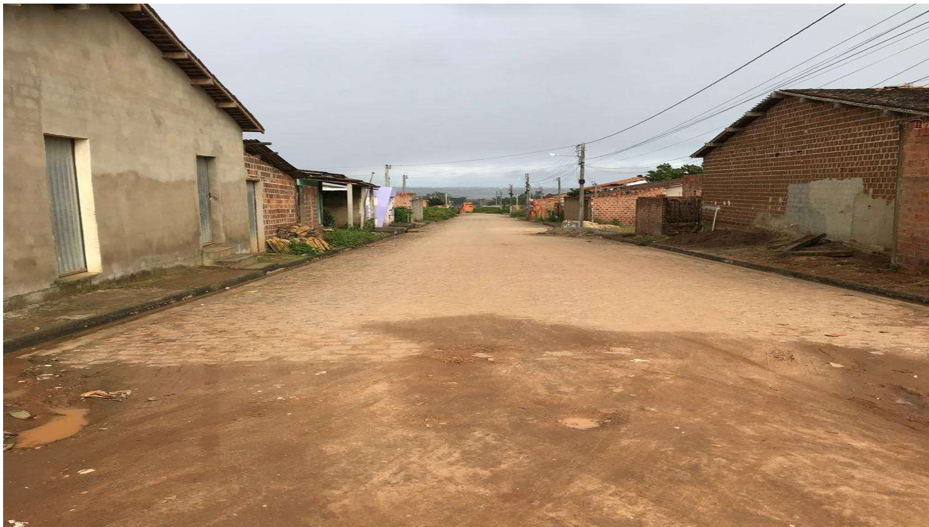
Figura 10- Rua 4 (Trechos inacabados)