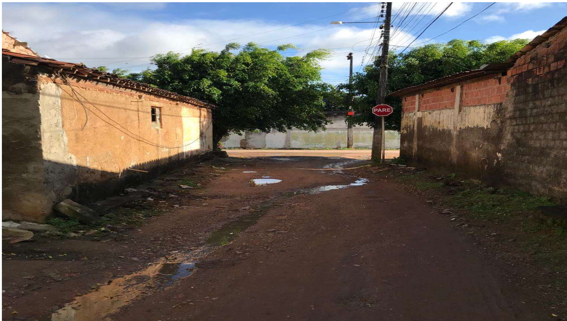
Figura 16: RUA 10 - VILA FERNANDES